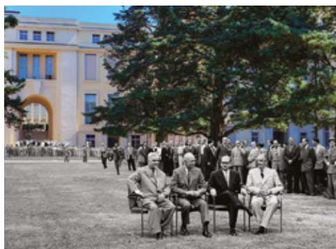
« The Geneva "Big Four" Conference » – depuis la gauche : N. Boulganine (USSR); D. Eisenhower (USA); E. Faure (France); A. Eden (UK), Palais des Nations, Genève, Juillet 1955.

Le 15 novembre 1920, la Société des Nations tenait sa première assemblée à Genève. Il y a 75 ans, naissait l'ONU, qui lui emboîtait le pas. Quelle meilleure occasion avons-nous donc de lancer ce bulletin parlementaire d'information sur la Genève internationale et son importance pour l'ensemble de notre pays ?