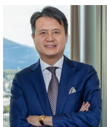
Daren Tang Direttore generale dell'Organizzazione mondiale della proprietà intellettuale (OMPI)

95% delle ONG intervistate ritiene che la loro presenza a Ginevra sia essenziale