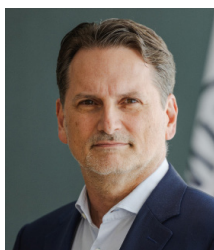
Pierre Krähenbühl Generaldirektor des IKRK

461 internationale Nichtregierungsorganisationen (INRO), davon hatten 231 im Jahr 2023 mindestens einen Arbeitsplatz in Genf