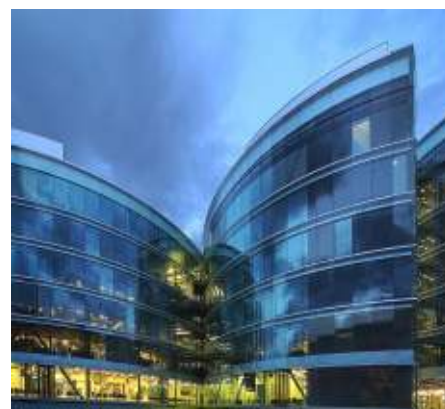
La Maison de la paix, siège de l'IHEID, haut lieu de la Genève internationale

Depuis 1978, le Prix de la Fondation pour Genève honore des Genevoises et des Genevois qui participent au renom de Genève en Suisse et dans le monde dans les domaines scientifique, politique, économique, culturel ou humanitaire.