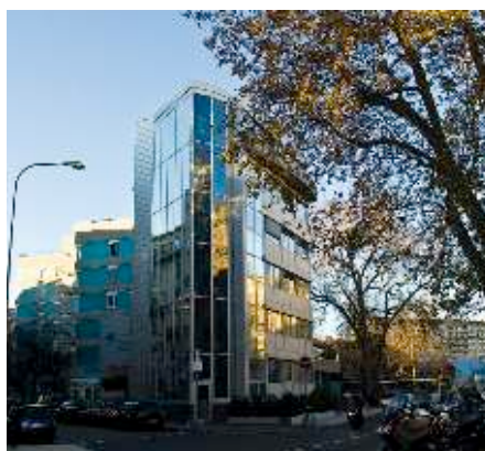
Bâtiment Rothschild, ancien siège de l'IUED