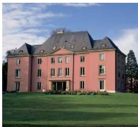
La Villa Barton, bâtiment historique de HEI