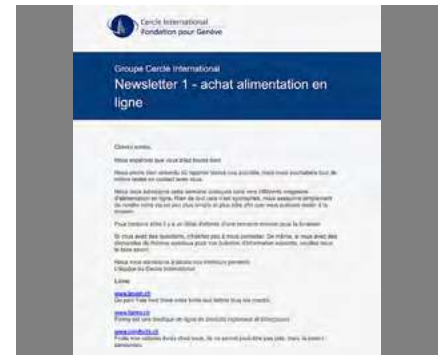
NEWSLETTER HEBDOMADAIRE De mars à décembre 2020