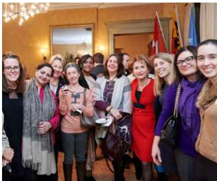
CONFÉRENCE AVEC CLAUDE NICOLLIER 4 février 2020

Claude Nicollier, astrophysicien et astronaute, a partagé sa passion pour le ciel, avec les membres du Cercle international, lors d'une conférence intitulée « La tête dans les étoiles ».