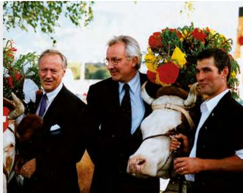
Geneva 2000 – Rencontre des peuples