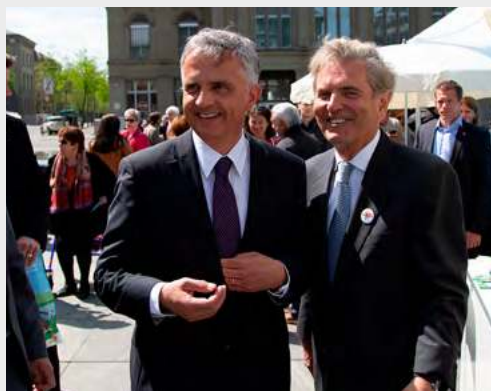
«Genève à la rencontre des Suisses» – Didier Burkhalter et Ivan Pictet