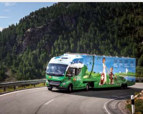
«Genève à la rencontre des Suisses»