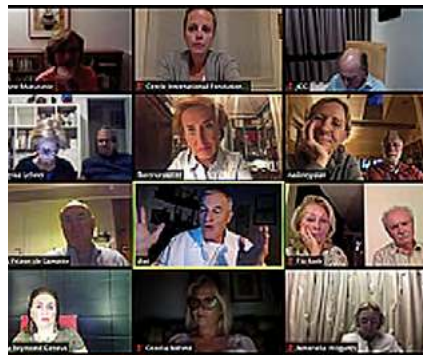
ENTRETIEN AVEC LE PROFESSEUR DIDIER PITTET (Visioconférence) 26 mai 2020

Claude Nicollier, astrophysicien et astronaute, a partagé sa passion pour le ciel, avec les membres du Cercle international, lors d'une conférence intitulée « La tête dans les étoiles ».