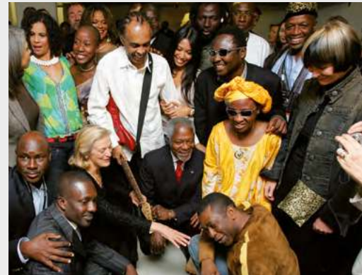
Concert «United Against Malaria»