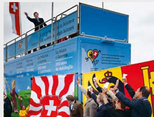
«Genève à la rencontre des Suisses»