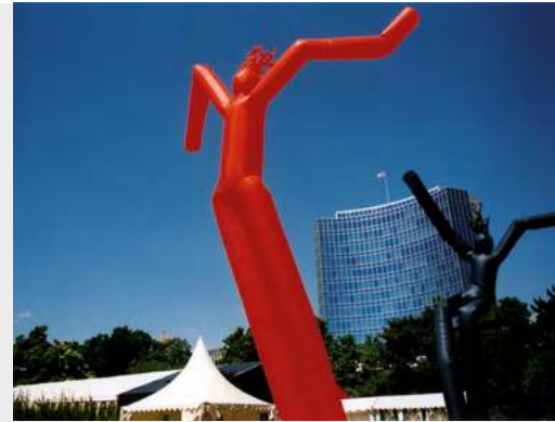
ONU – Week-end portes ouvertes