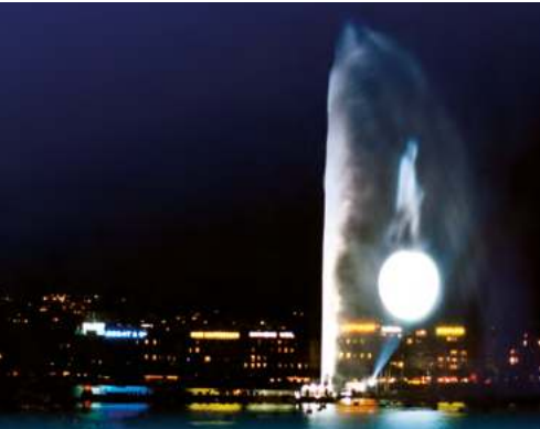
Geneva 2000 – Spectacle «Convergences»