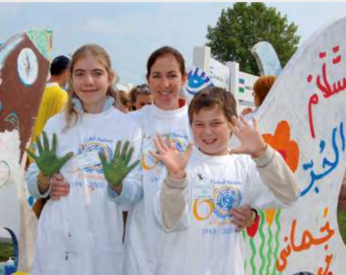
ONU – Week-end portes ouvertes