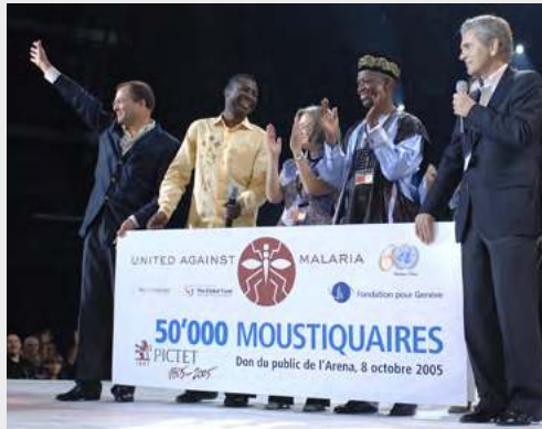
Concert «United Against Malaria»