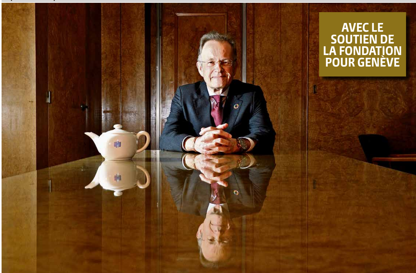
«Le monde a longtemps été dominé par la philosophie occidentale qui prône la primauté de l'individu. Le modèle chinois et asiatique préconise exactement l'inverse: la primauté de la communauté.»