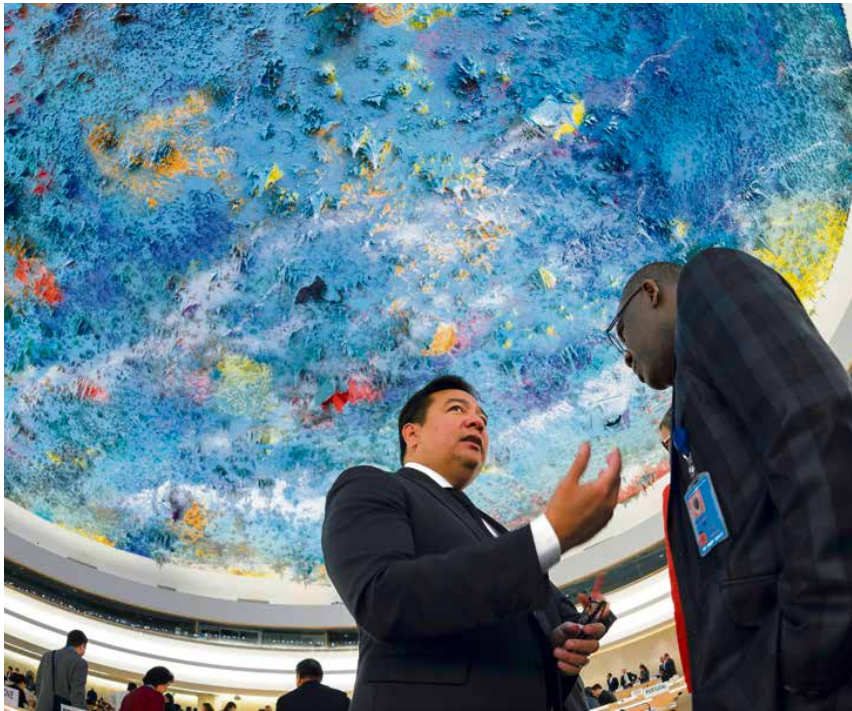
Au Palais des Nations, dans la salle des Droits de l'homme dont le plafond a été réalisé par l'artiste espagnol Miquel Barceló.