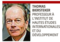
THOMAS BIERSTEKER PROFESSEUR À L'INSTITUT DE HAUTES ÉTUDES INTERNATIONALES ET DU DÉVELOPPEMENT

uni dans le dossier du nucléaire iranien, dans la gestion des conflits en Afrique. Mais je vois un problème pointer: maintenant que la Russie fait l'objet de sanctions, elle risque d'être beaucoup moins disposée à en imposer à d'autres. Cela a déjà ralenti l'action du Conseil de sécurité au Soudan du Sud et en République centrafricaine.