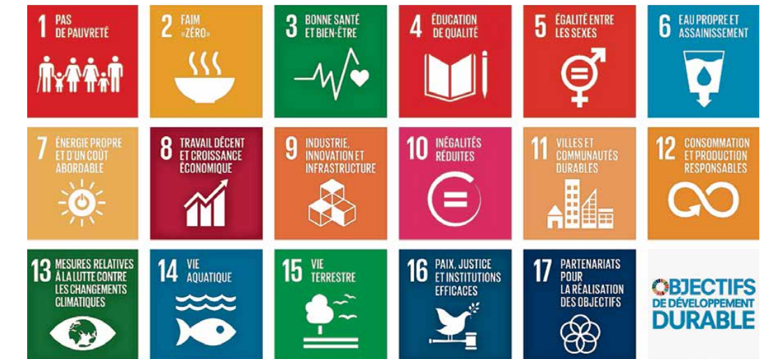
L'élaboration des 17 Objectifs de développement durable est le résultat de la coopération entre l'ONU, les Etats membres, la société civile et le secteur privé.