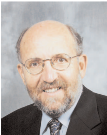
Professeur Michel Mayor

Michel Mayor est d'abord, définitivement et totalement, astronome. A quoi sert l'astronomie? Dans son abrégé d'astronomie, Monsieur de la Lande répond en 1774 de la façon suivante: "Je pourrais demander à mon tour: à quoi servent toutes ces choses inutiles ou dangereuses dont