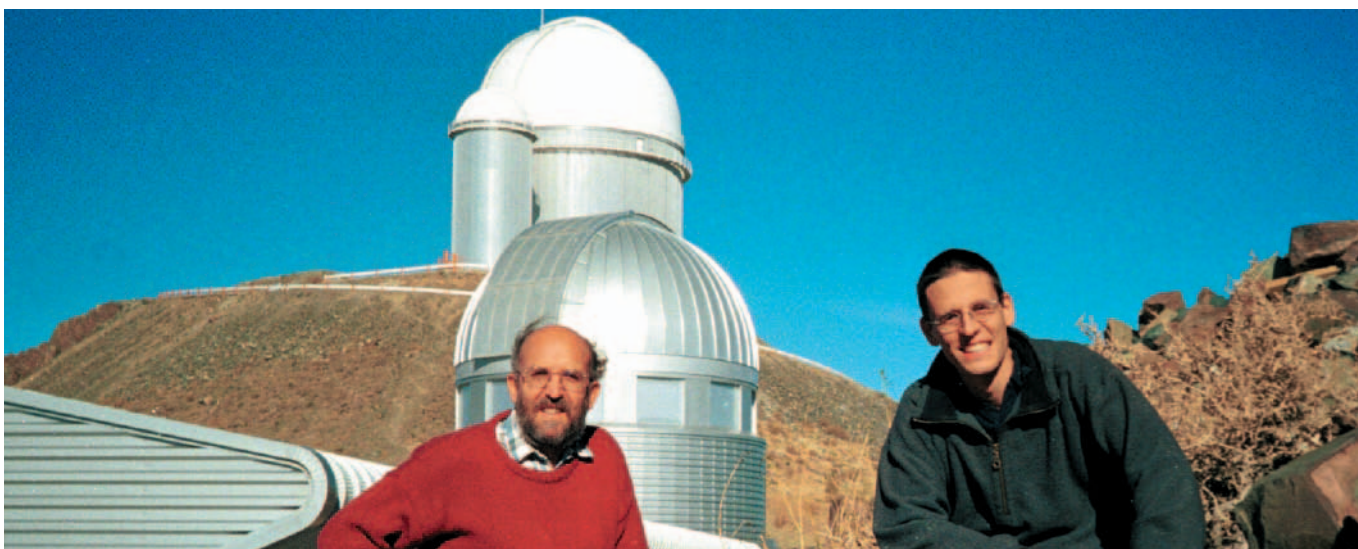
Professeur Michel Mayor et son collègue Didier Queloz, devant l'observatoire de la Silla au Chili

Il y a trente ans, Michel Mayor a hésité entre la physique des particules et l'astrophysique. Et c'est autour d'un verre, avec un ami, qu'il a décidé de prendre la route des étoiles. On peut dire qu'il fut plutôt bien inspiré! “ Nous avons commencé en même temps à l'Observatoire de Genève, il était passionné par la dynamique stellaire, c'est-à-dire l'étude des mouvements des étoiles dans la galaxie. Michel Mayor a d'abord étudié la théorie de ces mouvements, puis il a entrepris la construction d'un appareil pour mesurer la vitesse radiale des étoiles, c'est-à-dire la vitesse selon la ligne de visée. Un objet peut, en effet, être décomposé en étudiant sa vitesse soit de manière transversale, soit selon la ligne de visée. ”