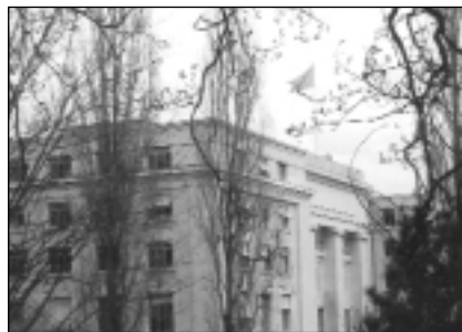
Les organisations internationales formulent leurs demandes

Moyens matériel, d'abord: Beaucoup de "nursing" dans ce secteur. Ouverture de Centres d'accueil pour Internationaux (La Pastorale) ou ONG (Genthod), guichet administratif unique et financements combinés pour entreprises, efforts des TPG et des taxis illustrent une mobilisation effec-