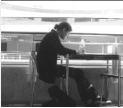
Un appel aux étudiants

tive qui nécessite encore l'injection de forces supplémentaires. Parmi les bonnes surprises, on remarque que, contrairement à une idée reçue, Cointrin n'a pas souffert des décisions de Swissair à son endroit. Au contraire : face à Zurich-Kloten, au cœur des routes aériennes encombrées, Genève-Cointrin joue la carte de la ponctualité dont sa rivale suisse ne peut plus se prévaloir. La qualité et le coût des télécommunications, d'une part, ainsi que l'efficacité de la sécurité, d'autre part, comptent parmi les arguments cités à l'avantage de Genève.